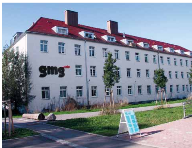
Siège de GMG Allemagne à Tuebingen

Nos produits sont le reflet de ces engagements. Sans se satisfaire de cette réussite, nous travaillons en permanence sur le développement de nos produits afin de pouvoir fournir aux Industries Graphiques des solutions complètes de standardisation et de simplification du flux de Gestion de la Couleur, depuis la création jusqu'au produit imprimé.